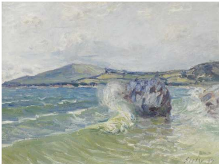
Lady's Cove, Pays de Galles, ALFRED SISLEY, 1897, MUSÉE DES BEAUX-ARTS DE ROUEN