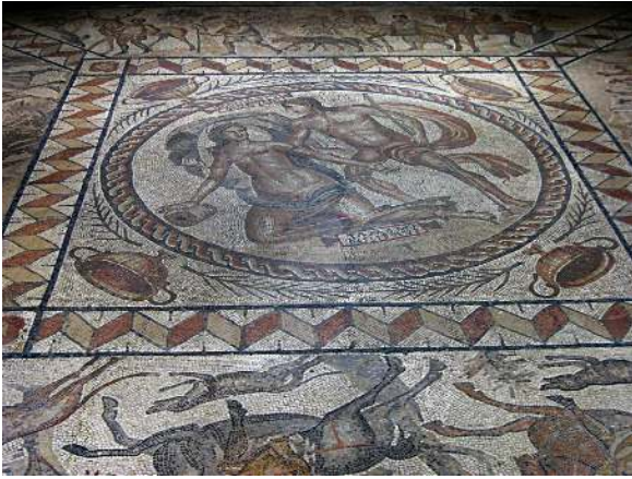
Mosaïque de la chasse, Musée des Antiquités, Rouen

Pour découvrir les collections Gallo-romaine du musée : https://museedesantiquites.fr/fr/collections/epoque-gallo-romaine